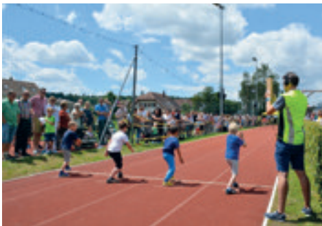
Keiner zu klein um dabei zu sein!