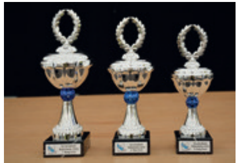
Pokale – in jeder Kategorie zu gewinnen.

Zur Abwechslung standen den Kindern auch eine Hüpfburg zur Verfügung.