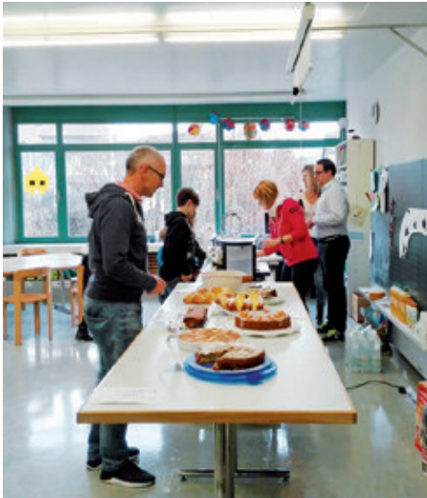
Die feinen Kuchen sind schon bereit.

Am Samstag, 10. März, fand der Besuchsmorgen der Primarschule statt. Interessierte Besucher konnten die offenen Kindergarten- und Schulzimmer besuchen und die verschiedenen Arbeiten der Kinder zu den aktuellen Unterrichtsthemen bewundern. Die Elternmitwirkung sorgte in ihrem Kafi-Stübli mit Getränken und feinen Kuchen für eine willkommene Verschnaufpause und Stärkung.