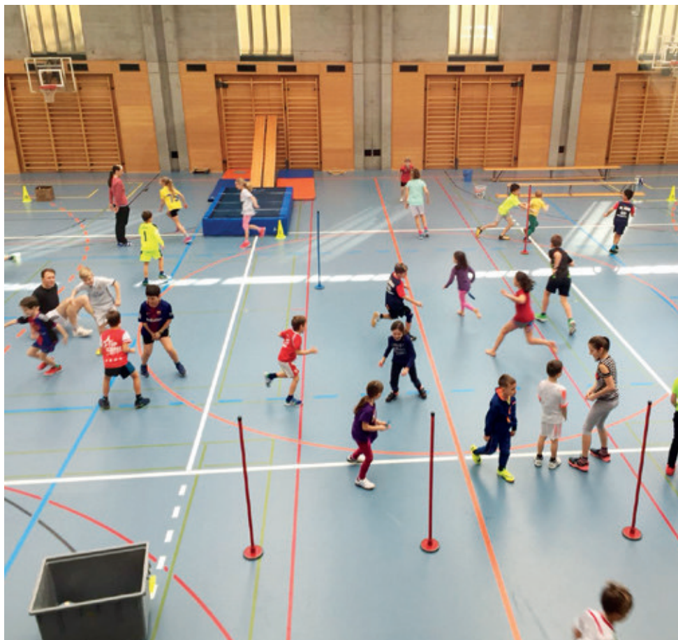
Spiel und Spass in der Sporthalle.